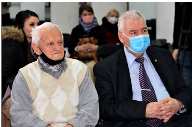
Vladimir Beșleagă și acad. Mihai Cîmpoi.